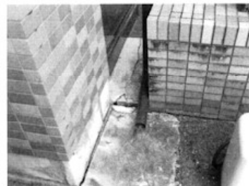
玄関口のタイル破損・ひびわれ・コンクリートの割れ