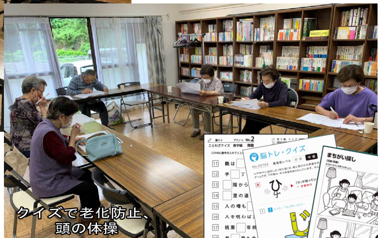
クイズで老化防止、頭の体操