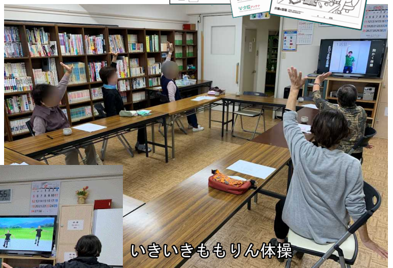
いきいきももりん体操