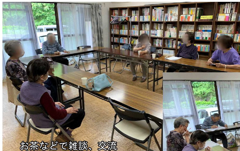
お茶などで雑談、交流

NHKのテレビ体操や皆の体操、いきいきももりん体操などで体をほぐしたり筋力アップに努めます。