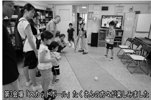
第3会場「スカットボール」たくさんの方が楽しめました

第2回町内一周まち歩きオータムフェスが、10月1日に御山越町内会主催で開かれました。開会式に続き、子供みこし巡行、スタンプラリーが行われ、平成会は第3会場としてスカットボールを担当しました。会場には、小学生から大人まで約70人が来場しスカットボールを楽しみました。最高得点は10点で5点以下が大部分でした。フィナーレでは、各イベントの表彰、手持ち花火が行われました。町内会からは、協力に感謝され終了しました。