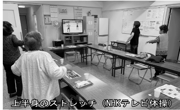
上半身のストレッチ (NHKテレビ体操)

シニアサロンは、月1回開いています。老化防止の体操や頭の体操、雑談など、盛りだくさんです。