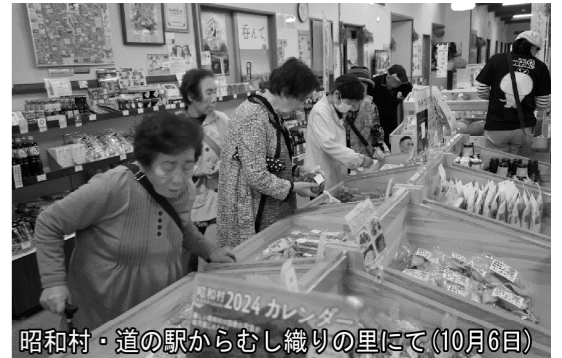
昭和村・道の駅からむし織りの里にて(10月6日)

その後、金山町や柳津町など奥会津の景色を眺めたり珍しい郷土品を買い求めたりしました。夕食後はカラオケやゲーム、談笑などで親睦を深めました。