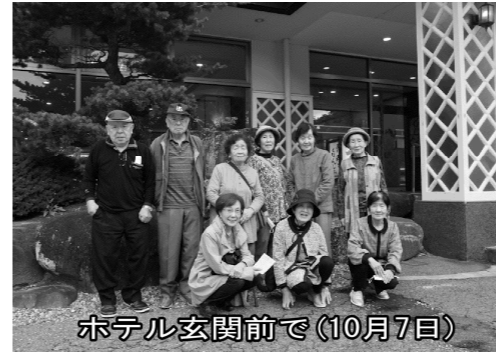
ホテル玄関前で(10月7日)

寒い季節の感染症対策①手洗い②マスク着用③加湿(結露に注意)④水分をとる⑤日向ぼっこ⑥ビタミンDをとる